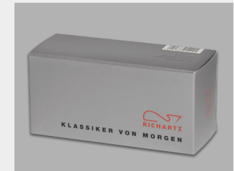
... mit Standardverpackung