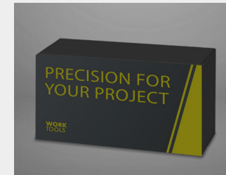
... als Markenbotschafter